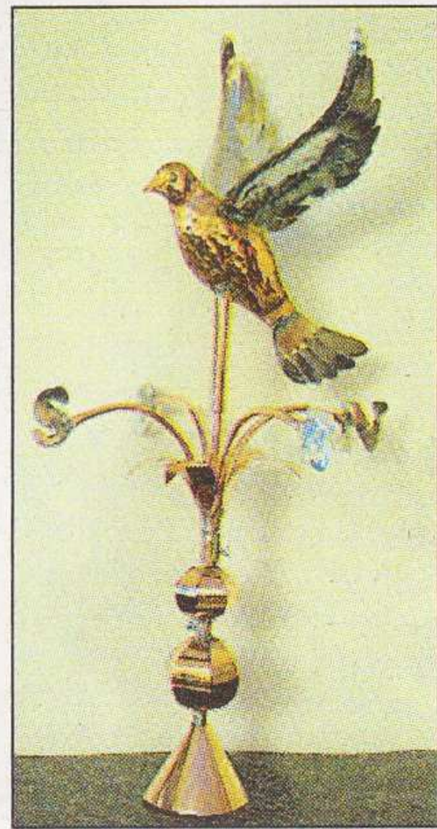
Un pigeon plus vrai que nature