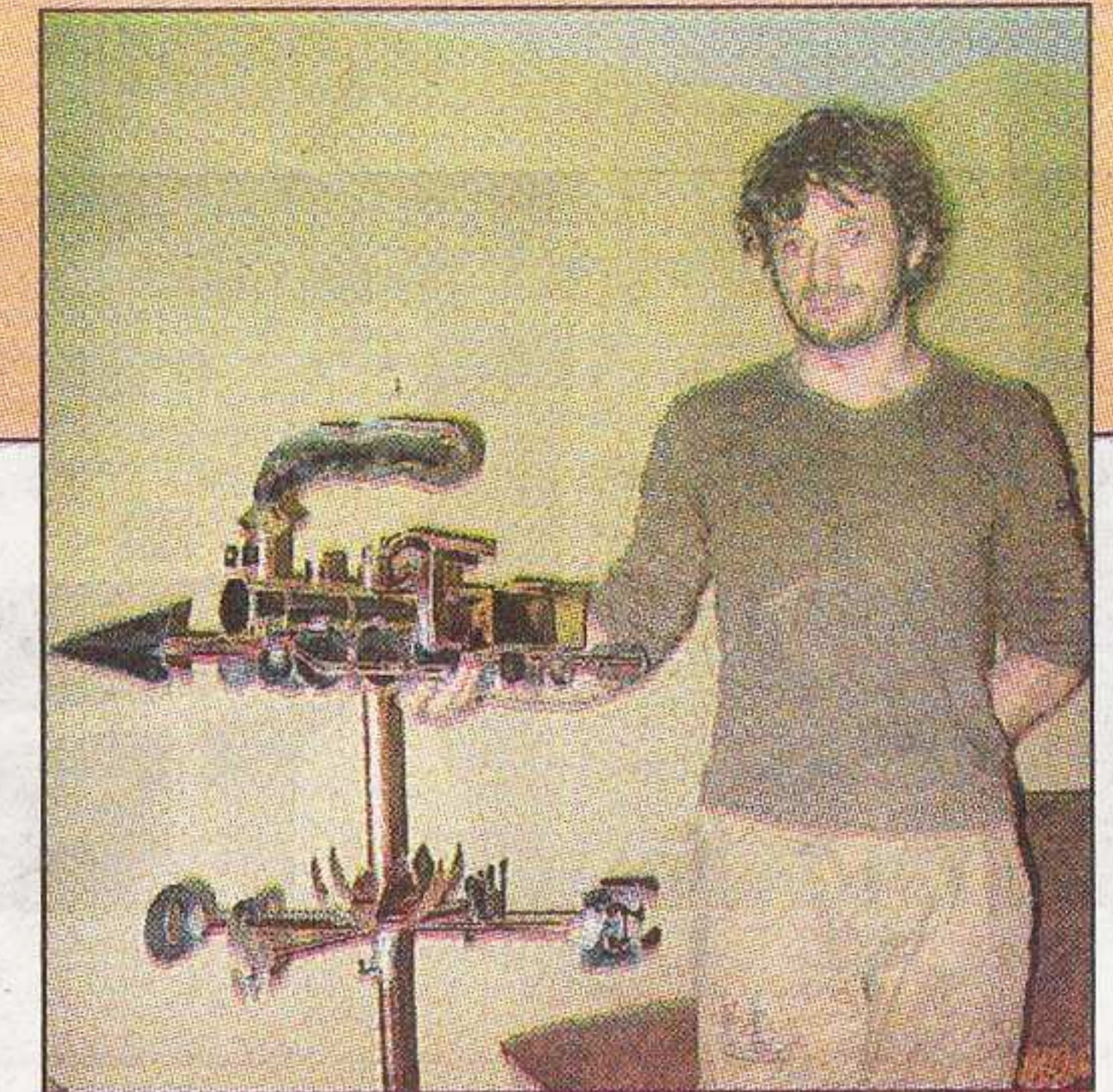
Un artiste-sculpteur de 29 ans, prétri de talent