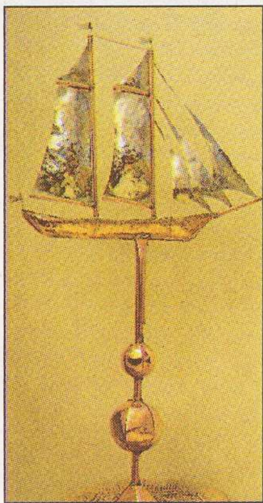
Un voilier girouette : sa première réalisation